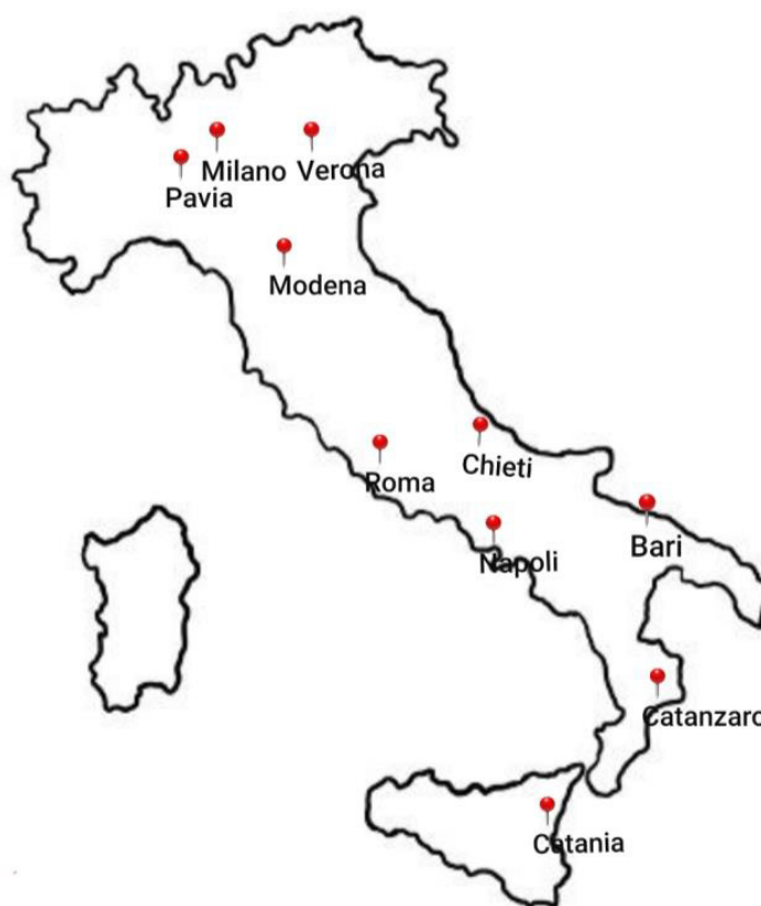
TAB. 1 - PRIMO ANNO

Ogni università ha un percorso di studi simile che dura 3 anni con un tirocinio formativo di circa 1500 ore.